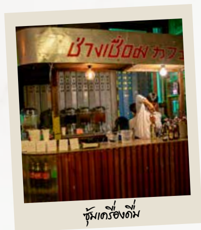
ชุดเครื่องดื่ม