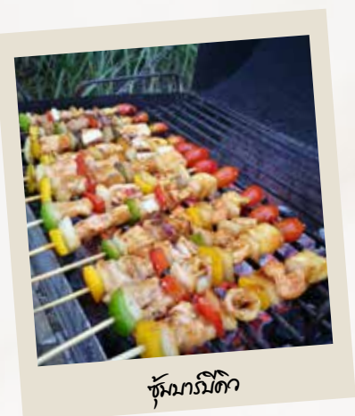
ซุ้มบาร์บีคิว