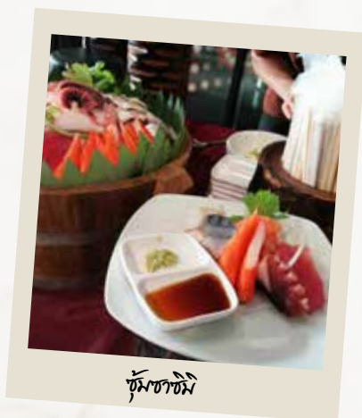
ซุ้มซาซิมิ