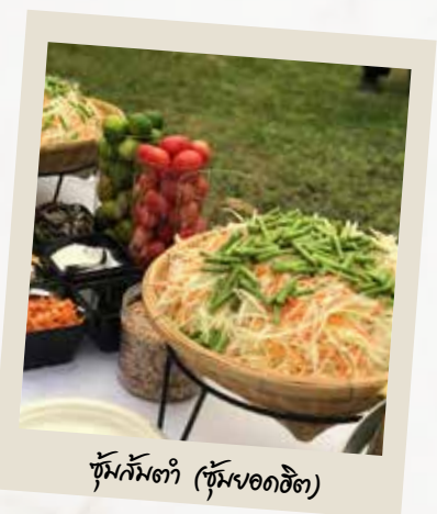
ซุ้มกิมถำ (ซุ้มยอดฮิต)