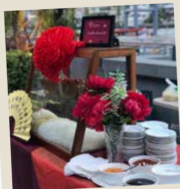
Yen Ta Fo (Thai Pink Noodle)