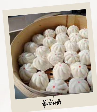
ซุ้มต้มยำ