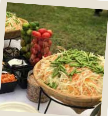
Spicy Papaya Salad