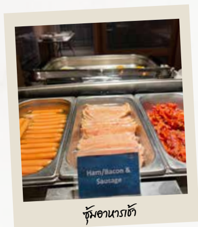
ซุ้มอาหารฮัท