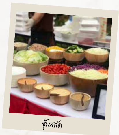
ซุ้มสลัด