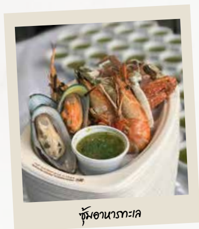
ซุ้มอาหารทะเล