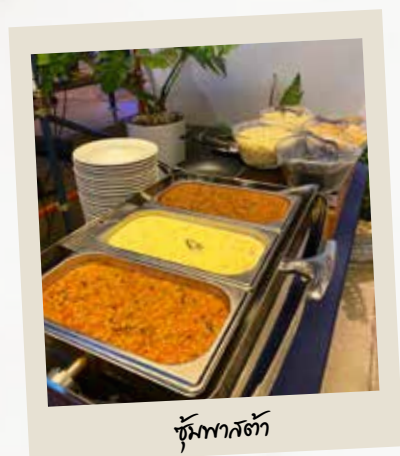
ชุ้มพาสต้า