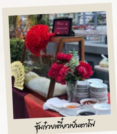
ซุ้มกิจกรรมเสิร์ฟอาหาร