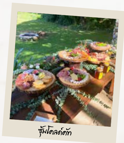
ชุ้มโคลด์คัท

เนื้อจัน 3 รายการ, ชีส 3 รายการ, ผักดอง, ผลไม้แห้ง, กุ้ง, ผลไม้ตามฤดูกาล, แตรเกอร์, ผักดอง, น้ำมัน