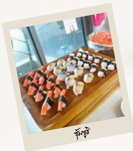
ซุ้มซูชิ